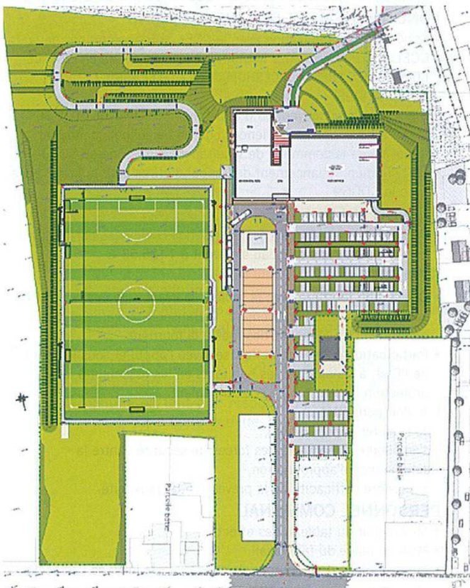
Plan de masse du Complexe